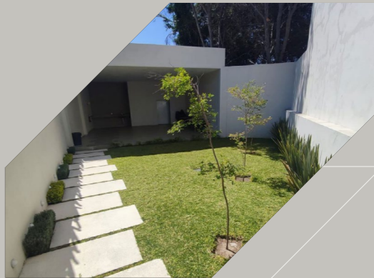
Departamento en Cordilleras $6,100,000 En Venta | $24,000 En Renta