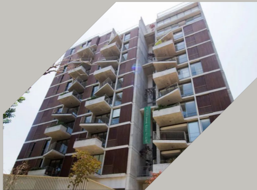
Departamento Arteza en Providencia $6,600,00 En Venta | $29,000 En Renta