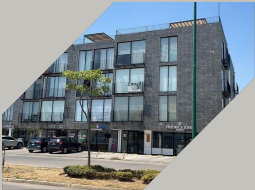
Departamento en Solares, Zapopan $4,100,000 En Venta | $26,000 En Renta